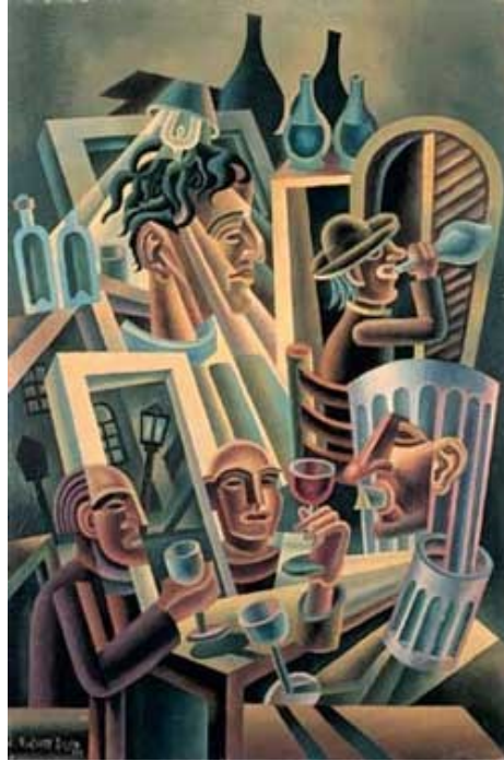
Quaderno di cantina